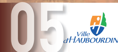
Présentation de la ville d'HAUBOURDIN